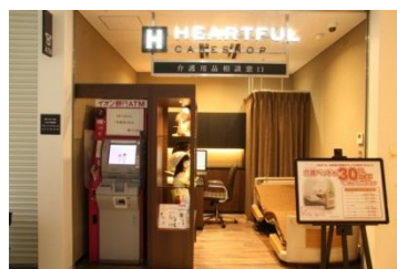
介護用品相談窓口 (1階)