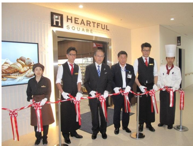
平成 28 年 6 月 13 日 営業開始のテープカット

平成 23 年より進めておりました海南病院施設整備の最後の建物となる教育研修棟が完成し、6 月 13 日にオープンしましたのでお知らせいたします。工事期間中は、騒音などにより大変ご迷惑をおかけしましたことをご詫言申し上げます。併せて、工事に際しましては、ご理解とご協力を賜りましたことについて感謝申し上げます。